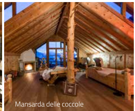
Mansarda delle coccole