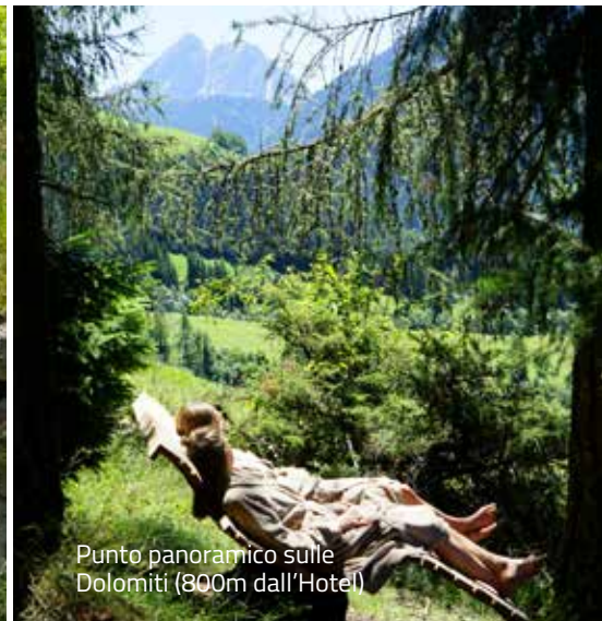
Punto panoramico sulle Dolomiti (800m dall'Hotel)