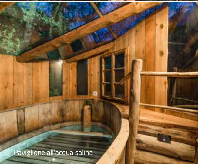
Paviglione all'acqua salina