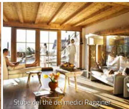
Stube del thè dei medici Ragginer