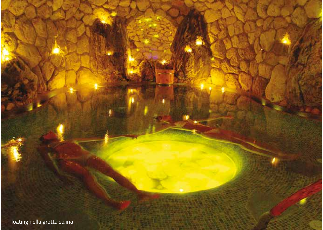
Floating nella grotta salina