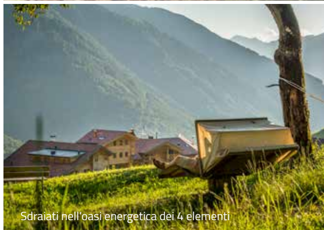
Sdraiati nell'oasi energetica dei 4 elementi