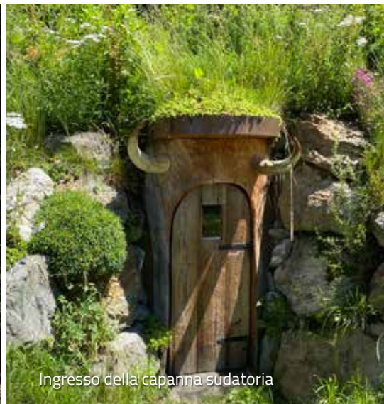
Ingresso della capanna sudatoria