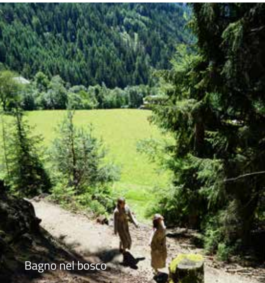
Bagno nel bosco

Vi verranno forniti 2 libretti con le istruzioni per il bagno nel bosco del valore di 19,80 € quando Vi iscriverete a questa attività.