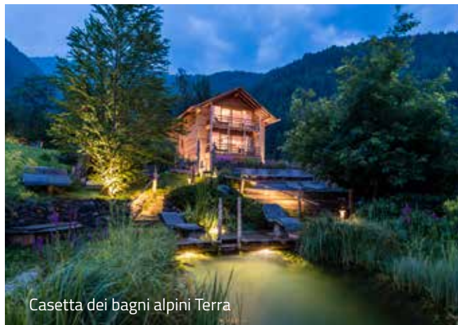
Casetta dei bagni alpini Terra

Famiglia Hinteregger e tutti i collaboratori.